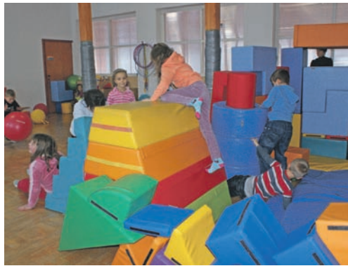
Kącik zabaw utworzony w ramach projektu „Radosna Szkoła”