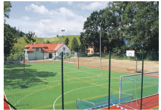
Nowe boisko wielofunkcyjne w Jastrzębiku