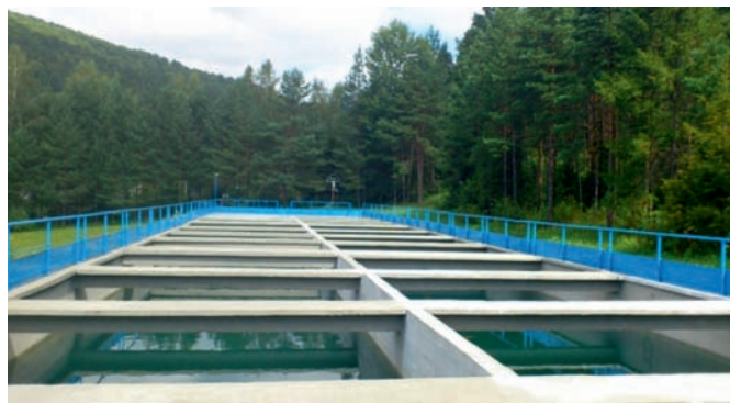
Widok po wykonanych pracach – Osadnik wstępny SUW „Jasieńczyk”