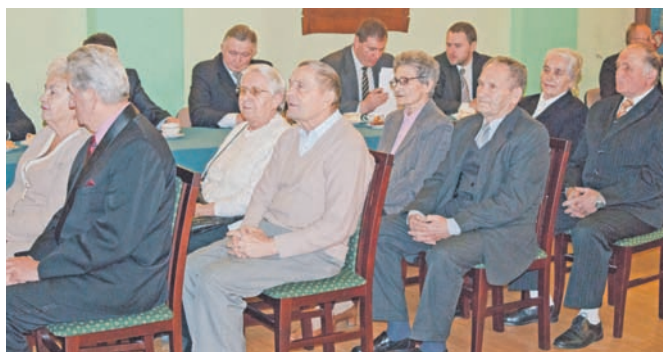
Dostojni jubileaci