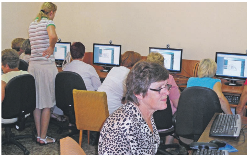
Uczestniczki projektu „O finansach.... w bibliotece”

Celem projektu było zwiększenie u osób starszych (50+) umiejętności korzystania z usług finansowych oraz wyposażenie bibliotekarzy w wiedzę, dzięki której będą w stanie pomagać starszym użytkownikom biblioteki w wyszukiwaniu informacji ekonomicznych, szczególnie przydatnych w życiu codziennym. Projekt był dofinansowany ze środków Narodowego Banku Polskiego, a jego założenia były zgodne z celami Programu Rozwoju Bibliotek (PRB), który zmierza do uczynienia z bibliotek publicznych ośrodków wiedzy i in-