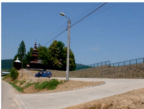
Nowy parking w Jastrzębiku