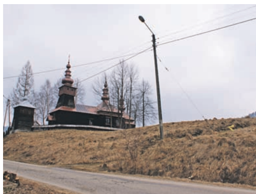
Niezagospodarowana łąka w Jastrzębiku