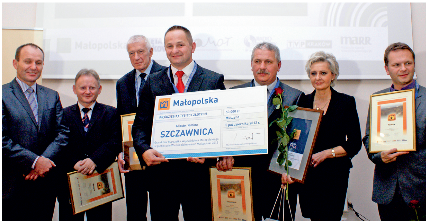
Laureaci plebiscytu Wielkie Odkrywanie Małopolski

P oczątkiem października br. w Hotelu Klimek SPA w Muszynie odbyła się finałowa gala XIII. edycji plebiscytu Wielkie Odkrywanie Małopolski połączonej z Małopolskimi Obchodami Światowego Dnia Turystyki.