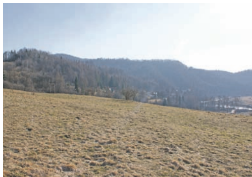
Łąka przed powstaniem ogrodów sensorycznych