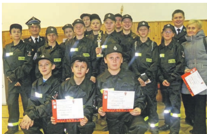
Młodzieżowa drużyna OSP Muszyna Folwark na zawodach w Lipanach

W dniu 9 listopada 2012 r. na międzynarodowe zawody halowe zaprzyjżnionych drużyn pożarniczych do Lipan wyjechało 14 drużów z Młodzieżowej Drużyny Pożarniczej przy OSP Muszyna-Folwark oraz 4 drużów przedstawicieli Muszyna-Folwark. Drużyna prezentowała się znakomicie pod względem: umundurowania, zachowania się i rywalizacji w zawodach sprawnościowo-bojowych. Zawody przeprowadzono według regulaminu obowiązującego w Unii Europejskiej, a dotyczącego Młodzieżowych Drużyn Pożarni-