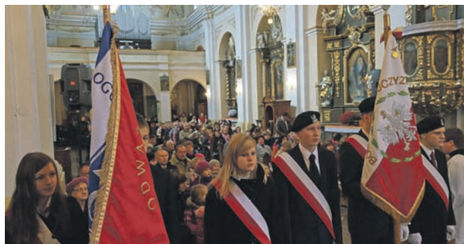
Rocznica Odzyskania przez Polskę Niepodległości