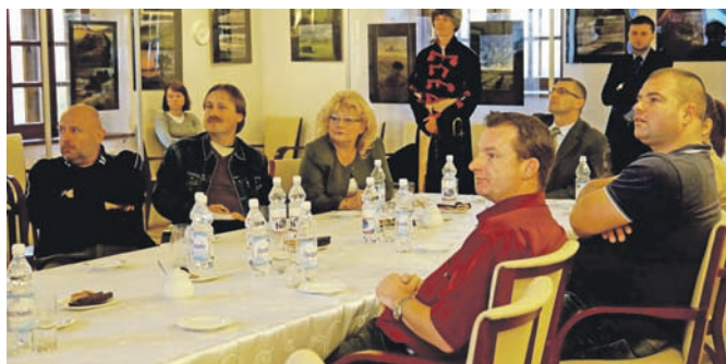
Delegacja z Węgier w Muszynie

W sobotę 17.11.2012 r. w Muzeum Regionalnym Państwa Muszyńskiego miało miejsce niecodzienne spotkanie. Władze Miasta i Gminy Uzdrawiskowej Muszyna podjęły delegację przedstawicieli ogólnokrajowych mediów i touroperatorów z Węgier. Wizyta zagranicznych gości to jeden z elementów kampanii promocyjnej Małopolski kierowanej na rynek węgierski. Zaproszeni goście byli bardzo zainteresowani śladami historii węgierskiej, których w naszym regionie nie brakuje. Podczas konferencji dziennikarze mogli się zapoznać z historią Muszyny, a także jej obecnym kształtem – modnego kurortu uzdrawiskowego. W trakcie zwiedzania atrakcji Muszyny wielkim zainteresowaniem Węgrów cieszyły się nowopowstałe ogrody senso-