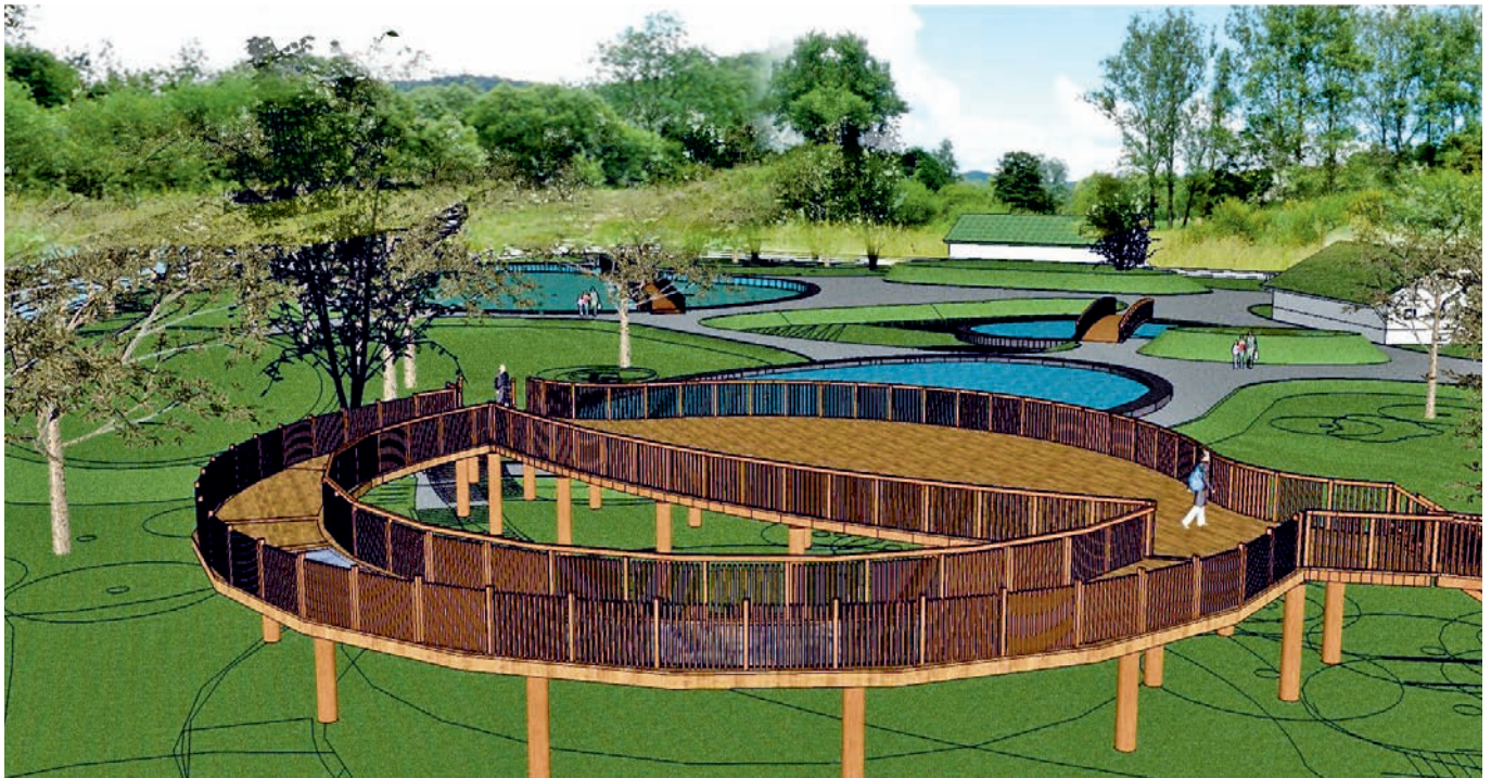
Wizualizacja stawów rekreacyjnych na „Zapoprzdzii” w Muszynie

ma na celu zwiększenie ruchu turystycznego w miejscowości Żegiestów – Zdrój. W ramach zamierzenia inwestycyjnego ten etap to dokończenie ciągu spacerowego, modernizacja istniejących kapliczek, budowa ozdobnych bram wejściowych. Uzdrowski charakter deptaku podkreślały będą niewielkie ogólnodostępne czepnie wody mineralnej. Koszt całego projektu to wartość 3 000 000,00 zł.