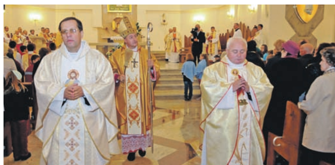
Konsekracja kościoła w Powroźniku