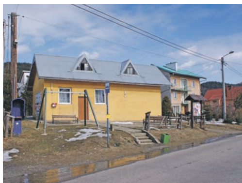
Świetlica w Jastrzębiku przed remontem