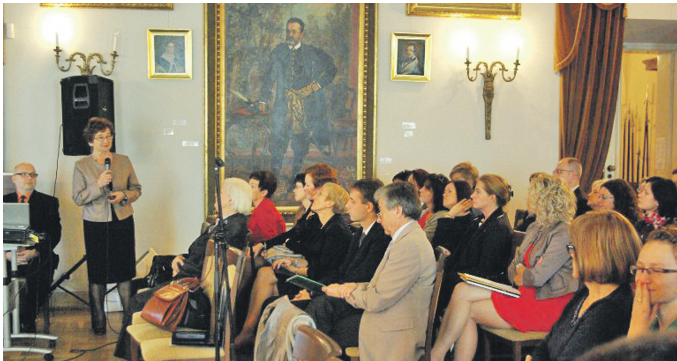
Uczestnicy konferencji „Nauczycielskie pasje inspiracją dla uczniów”

D nia 15 października 2012 r. w Muzeum Historycznym Miasta Krakowa w Sali Fontany odbyła się konferencja pod hasłem „Nauczycielskie pasje inspiracją dla uczniów”.