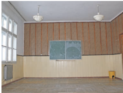
Warunki do nauki w starej szkole w Żłockiem