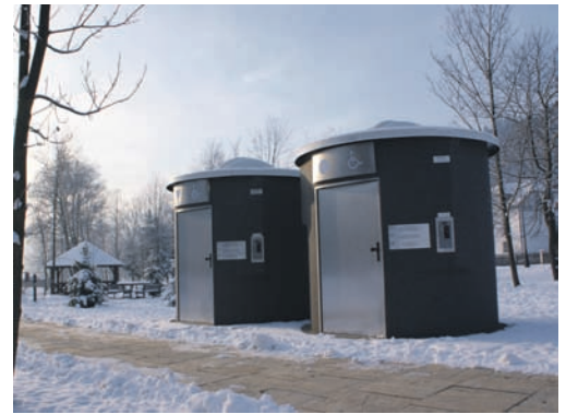
Toalety bezobsługowe w Parku Zdrojowym „Baszta”