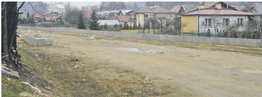
Obwodnica w trakcie budowy listopad 2012 r.

Odstąpienie od umowy z Wykonawcą inwestycji nastąpiło wyłącznie w związku z zaistnieniem sytuacji, która mogła spowodować nieodwracalne negatywne skutki finansowe (utrata dotacji unijnej) dla Gminy i niedokończenie budowy obwodnicy w założonym terminie. Zaistniała sytuacja związana z Generalnym Wykonawcą – który popadł w tarapaty finansowe (zgłoszenie wniosku o upadłość firmy „Cargo”) – nie pozwalała na terminową wypłatę podwykonawców. Z uwagi na wpływające do Gminy zajęcia wierzytelności (2 184 654,29 zł), brak wystawionych faktur przez wykonawcę, oraz przerwanie realizacji prac przy budowie obwodnicy, zaczęła się tworzyć sytuacja, że Gmina nie tylko zaczęła odpowiadać solidarnie za wypłatę podwykonawców, ale była narażona na zaistnienie tzw. podwójnych płatności . Mając powyższe na uwadze zwrócono się z wnioskiem do Sądu, aby ustalić sytuację finansową Wykonawcy. Pismem z dnia 15 października 2012 r. Sąd Rejonowy Katowice – Wschód w Katowicach Wydział X Gospodarczy, poinformował o fakcie złożenia w dniu 28 sierpnia 2012 r. do ww. Sądu wniosku wierzycieli o ogłoszenie upadłości obejmującej likwidację majątku Grupy Finansowej Cargo. W tej sytuacji Gmina biorąc pod uwagę solidarną odpowiedzialność względem rozliczenia