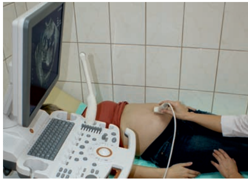
Nowy aparat do badań USG w SPZPOZ w Muszynie