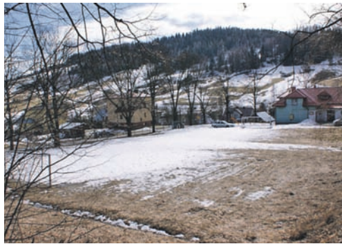
Stare boisko przy szkole w Jastrzębiku

Może o tym nie wiemy, ale przychody podatkowe (PIT, podatek od nieruchomości, CIT, opłata uzdrowskowska) np. od jednego dużego wyciągu narciarskiego wynoszą w skali roku ok. 230 tys. zł.; – od dużego sanatorium ok. 290 tys. zł.; – od dużego marketu (Tesco,