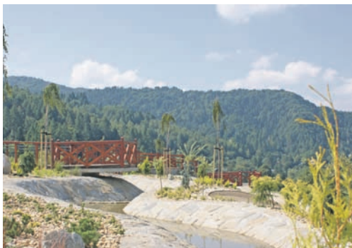
Ogrody sensoryczne po realizacji projektu