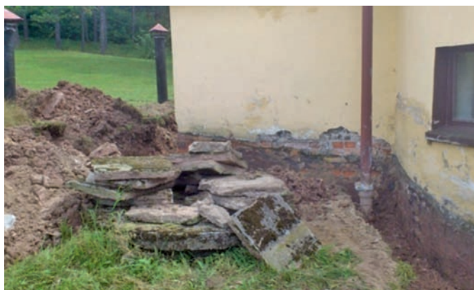
Stan początkowy – Budynek przy zbiornikach wody pitnej – SUW „Jasieńczyk”