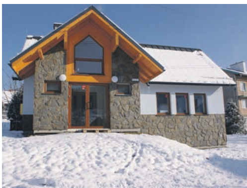
Świetlica w Jastrzębiku po remoncie