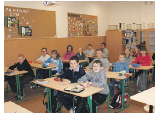
Warunki do nauki w nowej szkole w Żłockiem