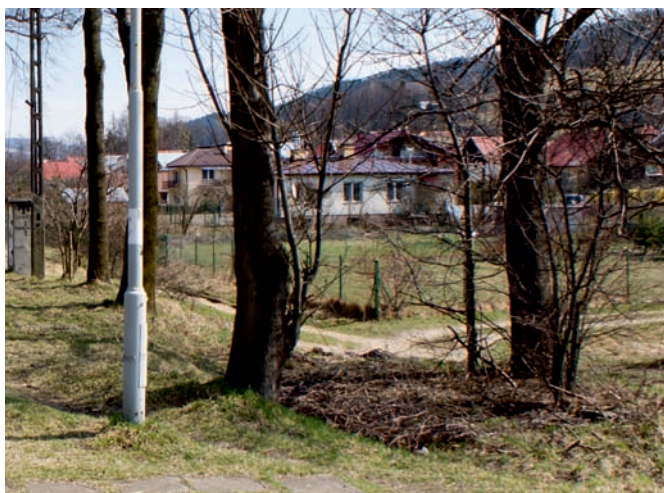
Teren przed przystąpieniem do budowy obwodnicy

podwykonawców, zmuszona została do skorzystania z przysługującego jej prawa i odstąpiła od umowy z Wykonawcą. W obliczu bezprawnych działań podejmowanych przez Generalnego Wykonawcę, podwykonawcy realizujący prace wezwali Miasto i Gminę Uzdrowską Muszyna do zapłaty kwoty w wysokości 2 639 867,49 zł , tytułem nieuregulowanej przez Generalnego Wykonawcę faktury za wykonane roboty budowlane, realizowane przy obwodnicy Muszyny i takie należności ze strony Zamawiającego im przysługują i zostaną wypłacone po dopełnieniu wszystkich formalności .