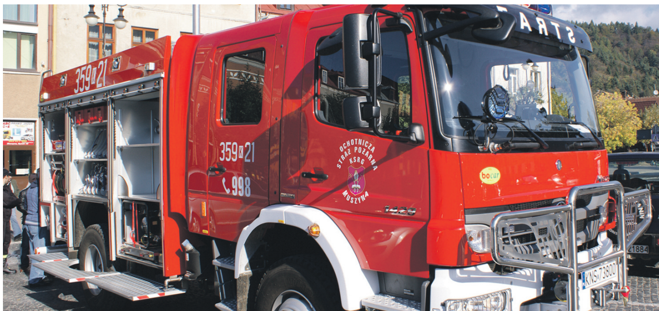
Nowy wóz strażacki OSP Muszyna

W dobie licznych zagrożeń, a szczególnie nieprzewidywalnych zjawisk atmosferycznych, które z coraz większą częstotliwością nękają człowieka, bezpieczeństwo staje się priorytetowym i najbardziej pożądanym stanem każdego państwa, podstawową potrzebą człowieka. Przed dobrym wypełnieniem tego zadania stają wszystkie organy władzy publicznej oraz podległe im służby ratownicze. W pamięci mieszkańców Muszyny na pewno zapisały się traumatyczne wydarzenia z ostatniej powodzi, która uderzyła z ogromną siłą niszcząc gospodarstwa domowe i infrastrukturę komunalną. Powodzenie wielu akcji ratowniczych, koordynowanych przez jednostki pożarnicze w Muszynie zależało nie tylko od właściwego przygotowania jednostek, ale od wyposażenia, którego brak powodował pewne ograniczenia w działaniach. Dzisiaj wiele jednostek Ochotniczych Straży Pożarnych w powiecie patrzy na nas z zazdrością, bo posiadanie nowoczesnego samochodu typu Mercedes-Benz Atego GBA