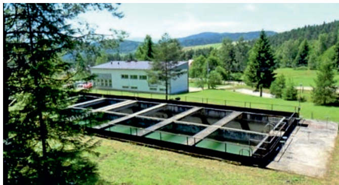
Stan początkowy – Osadnik wstępny SUW „Jasieńczyk”