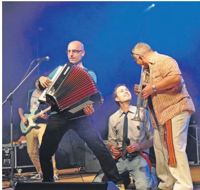
Jesień Popradzka

W przeddzień uroczystości Wszystkich Świętych w kościele p.w. św. Józefa Oblubieńca NMP w Muszynie odbył się koncert o tematyce egzystencjalnej pt. „Wigilia Zaduszek”. Muzyczna opowieść o ziemskim pielgrzymowaniu rozpoczęła się piosenką pt.: „Wędrowną jedną życie jest człowieka” w wykonaniu młodych ludzi, którzy tworzą wokalną grupę Miejsko-Gminnego Ośrodka Kultury w Muszynie. W dalszej części koncertu wykonawcy prezentowali nastrojowe utwory, którym nieodłącznie towarzyszyła multimedialna prezentacja nawiązująca tematycznie do śpiewanych piosenek. Zebrana tego wieczoru publiczność usłyszała między innymi takie przeboje jak: „Dziwny jest ten świat”, „Strażnik Raju”, „Jaka róża taki cieć” czy „Modlitwa” Bułata Okudźawy, a także wiele innych, które wprowadziły uczestników w atmosferę refleksji i zadumy nad sensem ludzkiego bytowania. Koncert odbył się już po raz trzeci, zawsze ciesząc się dużym zainteresowaniem zarówno wśród mieszkańców naszego uzdro-