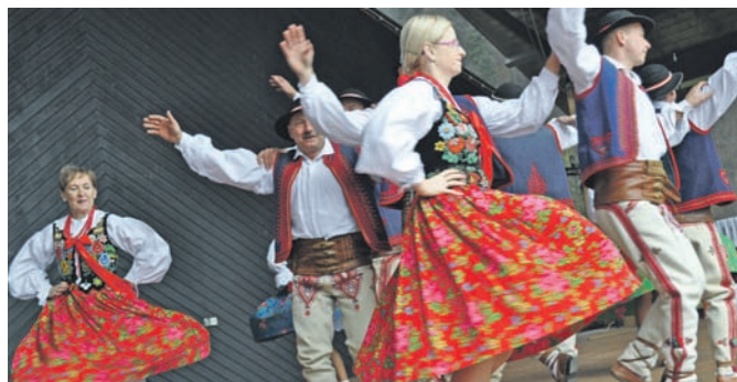
Sądecki Festiwal Kultury

wiska jak i wypoczywających w nim gości.