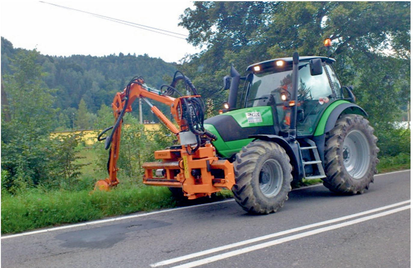
Koszenie poboczy