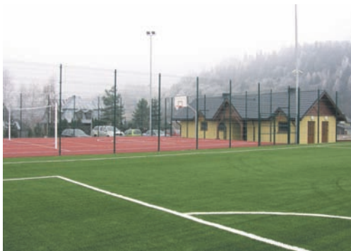
Nowy Orlik w miejscu starego boiska w Szczawniku