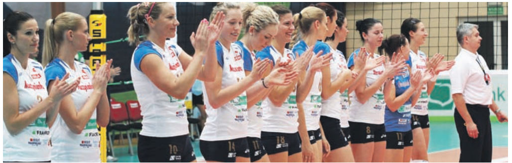
Zespół Bank BPS Muszynianka Fakro

mamy zespół ciągle walczący o najwyższe cele. Zdobywając srebrne krążki, drużyna zasłużyła na słowa pochwały, a przyznanie zespołowi „dzikiej karty” i danie możliwość uczestniczenia w tegorocznej edycji Ligi Mistrzyń jest dowodem uznania w europejskich władzach CEV.