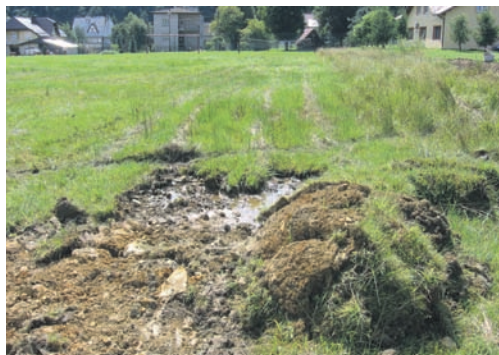
Stare boisko w Szczawniku FOT. ARCH. UMIGU MUSZYNA