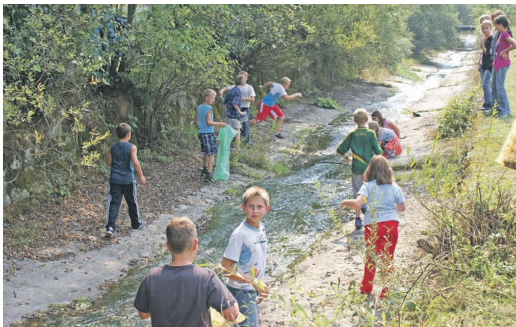
Młodzież sprzątająca Żegiestowski potok