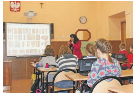
Nowoczesna klasa szkolna w ZSP w Muszynie z multimedialną tablicą oraz laptopami