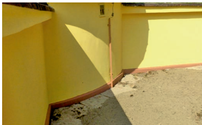
Widok po wykonaniu prac – Budynek przy zbiornikach wody pitnej – SUW „Jasieńczyk”