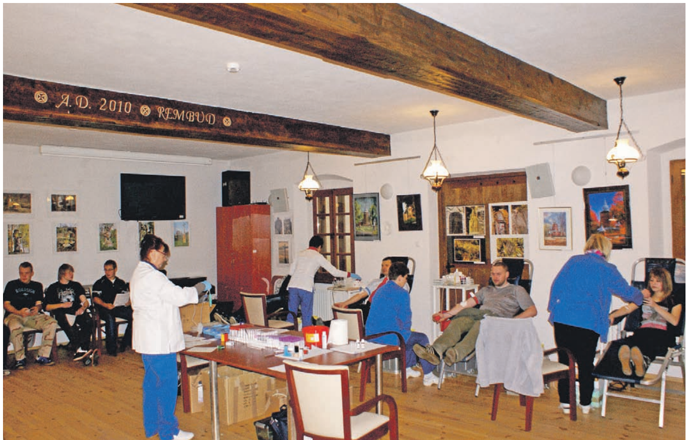
V akcja poboru krwi w Muszynie

W niedzielę 26 października 2012 r. w Muzeum Regionalnym Państwa Muszyńskiego odbyła się już piąta edycja cieszącej się coraz większym powodzeniem akcji „Oddając krew ratujesz życie”. Drugi rok zbiórki krwi skłania do podsumowań, wspomnień i refleksji. Inspiracją dla zorganizowania akcji poboru krwi w Muszynie było rozpropagowanie wśród mieszkańców szlachetnej idei pomocy innym, a celem było zebranie jak największej ilości tego bezcennego daru. Zachętą stało się powodzenie podobnych, cyklicznych akcji organizowanych w Krynicy-Zdroju. Dodatkowym argumentem przemawiającym za podjęciem akcji były napływające z krynickiego szpitala informacje o problemach z pozyskaniem krwi, szczególnie w sezonie letnim, kiedy wzrasta wypadkowość na drogach i liczba po-